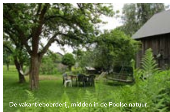
De vakantieboerderij, midden in de Poolse natuur.