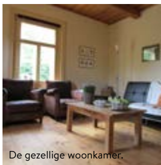
De gezellige woonkamer.

“De verhuizing naar Polen verliep in etappes en met hulp van veel vrienden, vriendinnen en familie. Mijn vader kluste zich de ziel uit het lijf: onder meer de stal moest omgebouwd worden tot sanitaire